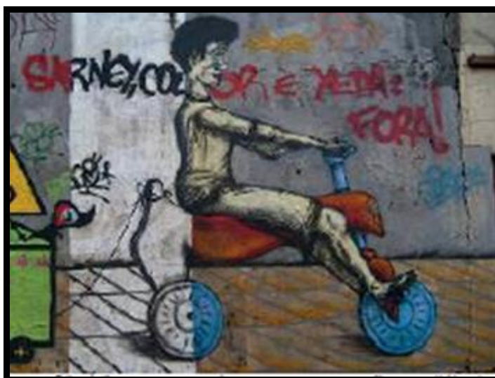
Foto 9. Álbum porto alegre grupo, autor Bruno Oliveira. Fonte: flickr , acesso:2010;

Embora possa haver uma distinção conceitual entre as duas técnicas, ambas dividem e se mesclando nos/aos espaços, incluindo as imagens que estão dentro dos lugares oficiais das artes. Na próxima foto 9 vemos um grafite de um menino circulando de bicicleta, transportando uma caixa repleta de brinquedos. Ao fundo, um muro - criado na mesma imagem - sob o qual se registra, em forma de pichação, uma frase de teor contestatório “ Fora Sarney, Collor e Yeda: Fora! ”. Nota-se que a pichação não se sobrepõe ao rosto do menino, o que produz um efeito bidimensional no desenho - ele está em primeiro plano e o muro está ao fundo.