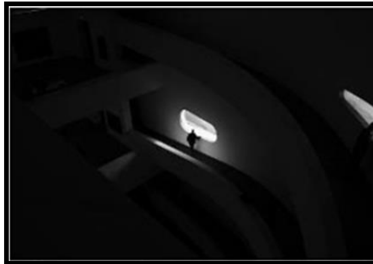
Foto 4. Álbum:porto alegre grupo;autor: Bernardo Garden Creek.Fonte: flickr ,acesso:2010.

assumir uma atitude contemplativa diante de um “templo” no qual se resguarda uma arte considerada valiosa. Nesta fotografia se utiliza uma inversão de cores. As brancas paredes do museu são retratadas no escuro de modo a acentuar o aspecto enigmático e misterioso do lugar.