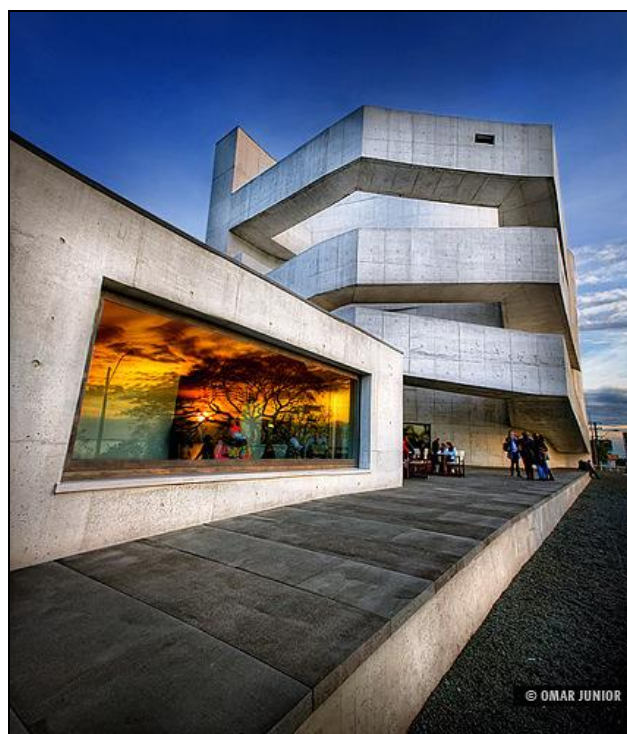
Foto 3. Museu Iberê Camargo: Porto Alegre

linguagem contemporânea de linhas arquitetônicas, as quais destacam a volumetria e conferem ao prédio o porte de uma escultura. Essas características são marcantes nas fotografias dos álbuns. Esse prédio é apresentado, via de regra, com recursos que acentuam a monumentalidade e imponência. Aliado a isso, há aquelas que exploram formas irreverentes, lembrando propostas artísticas contemporâneas, como é o caso da Foto 3, na qual se observa em destaque o reflexo do pôr do sol na vidraça. As cores vivas contrastam com o prédio escultórico branco e tudo isto tem como moldura um azul celeste quase monocromático – um monumento à arte.