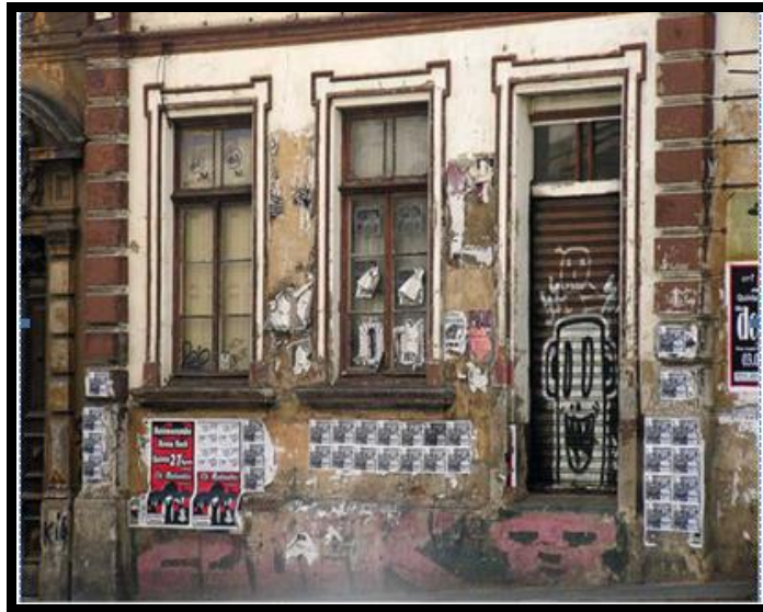
Foto 8. álbum:porto alegre grupo

Embora possa haver uma distinção conceitual entre as duas técnicas, ambas dividem e se mesclando nos/aos espaços, incluindo as imagens que estão dentro dos lugares oficiais das artes. Na próxima foto 9 vemos um grafite de um menino circulando de bicicleta, transportando uma caixa repleta de brinquedos. Ao fundo, um muro - criado na mesma imagem - sob o qual se registra, em forma de pichação, uma frase de teor contestatório “ Fora Sarney, Collor e Yeda: Fora! ”. Nota-se que a pichação não se sobrepõe ao rosto do menino, o que produz um efeito bidimensional no desenho - ele está em primeiro plano e o muro está ao fundo.