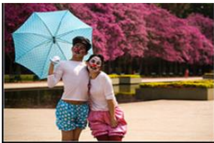
Foto 6. Álbum: porto alegre grupo, autor: Stefani Marcelo. Fonte: flickr, acesso: 2010

passam a ser considerados templos, há também uma ressignificação das catedrais e praças, apresentadas, então, por sua importância artística. Podemos encontrar inúmeras fotografias, além das dos espaços consagrados e institucionalizados, que identificam Porto Alegre com distintas formas artísticas. Temos o caso da praça situada em frente ao Mercado Público que atua como cenário, um local onde as manifestações artísticas, consideradas populares, se expressam desde o cantor popular com sua guitarra, ao teatro de rua, a apresentação dos palhaços - quase invisíveis em meio aos transeuntes – à menina que vê uma bienal de artes em um espaço consagrado, ou os meninos que abraçam a estátua do poeta Mário Quintana, junto à feira do livro. Todas essas imagens nos fazem pensar em atividades cotidianas, nas quais as pessoas apreciam, “brincam” e fazem arte. Nelas podemos ver uma possível intimidade, quase a nos dizer: “nesta cidade se vive a arte”, embora muitas vezes estas manifestações possam nos parecer tão comuns que não mais nos detemos a olhar. As fotografias nos mostram (constroem) que a arte está presente no dia a dia da cidade, retratada em cores e em preto e branco, com um público muitas vezes atento, outras vezes não. Entre as várias fotografias encontradas nos álbuns, destaco a foto a seguir, ela apresenta dois atores em uma apresentação “circense”, em um dos parques mais conhecidos da capital a Redenção, ponto de feiras e encontros aos fins de semana da população.