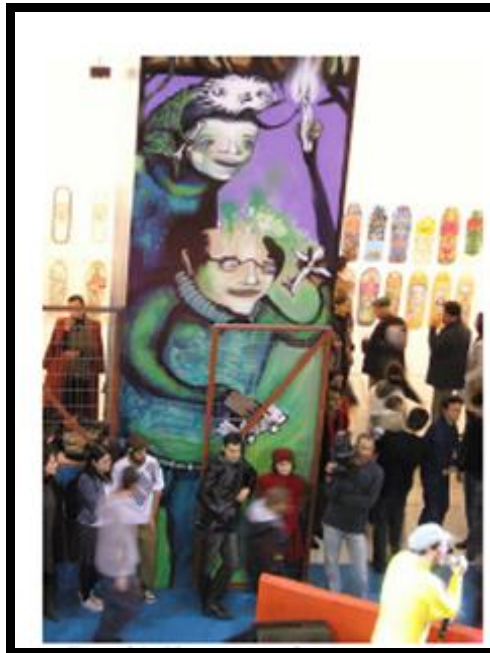
Foto 2. álbum porto alegre grupo; autor: Eduardo Nasi; fonte: flickr acesso: 2010

Há registros de acontecimentos vinculados à arte, a exemplo a Foto 2, de uma mostra de trabalhos em grafite. Trata-se de uma imagem na qual a grandiosidade da edificação, com sua solidez e sobriedade, cede lugar às cores vivas, às formas e às texturas específicas do grafite. O foco de nossa atenção, ao olhar a imagem, é a obra exposta, com o seu porte, a sua exuberância e, ao mesmo tempo, a sua fluidez de uma imagem grafitada. As pessoas que podemos ver, na fotografia, circulam por entre diversas obras, observam diferentes pontos da cena, o que amplia o sentido de provisoriedade da arte ali exposta. O enquadramento escolhido, o ponto de vista superior e a fotografia em cores refoca a ideia de descontração e liberdade artística do ambiente.