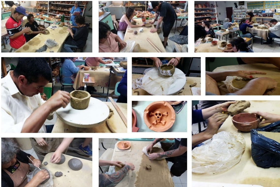
Figura 1: Cerâmica e Alimento . Alunos da escola e convidados modelando tigelas em sala de aula. 2017.