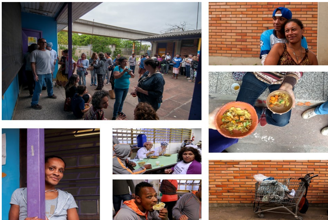
Figura 3: Cerâmica e Alimento . A confraternização envolvendo alunos, colaboradores e visitantes 2017.