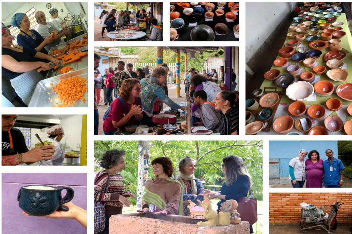
Figura 2: Cerâmica e Alimento . Almoço realizado na EPA. 2017.