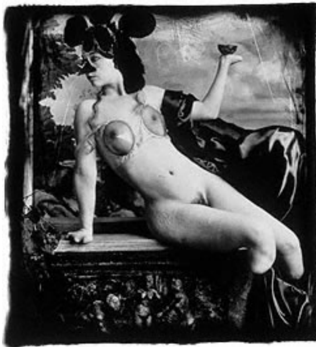
WITKIN, Joel-Peter. Humor e Medo. 1999.

Estas obras nos questionam sobre os ideais da Arte, que se diferenciariam das demais inserções do homem na cultura. Afinal, sempre estamos lidando com nossas condições singulares no nosso metier , seja ele qual for. O que não justifica, de modo algum, uma análise do sujeito pelo produto de seu fazer, isto é, apenas indício e, paradoxalmente, muito mais do que se queria ter expressado. Seria mais apropriado supor que não há relação direta de causa e efeito e, sim, uma multiplicidade de arranjos que se precipitam ao constituir uma obra. Não há uma essência a ser vista, como diria Jaques Lacan, não há nada mais verdadeiro que a ficção.