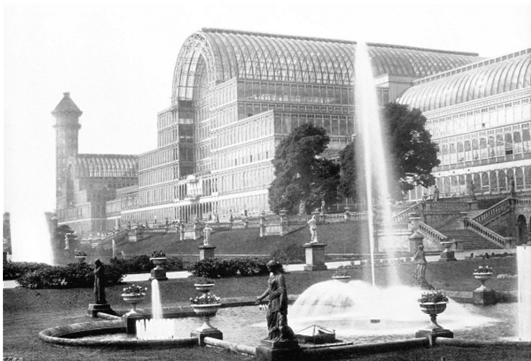
Fig. 3. Palácio de Cristal em Sydenham. Sem data.

Paxton desenhou o grande pavilhão de ferro e vidro para a Exposição de Londres em julho de 1850. Ele media, simbolicamente, 1,851 pés (564 m) e foi erguido em apenas nove meses (fig. 3).