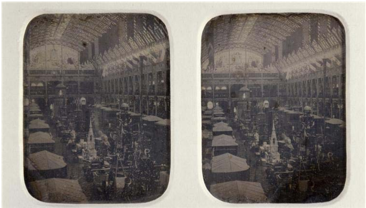
Fig. 4. Exposição Universal de 1855, Paris, Palácio da Indústria, exposição parcialmente montada. Anônimo. Daguerreótipo, estereoscopia, 1855.