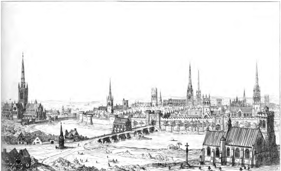
Fig. 2. A mesma cidade no século XIV.

A imagem seguinte (fig. 2) mostra a antítese e o antídoto para essa lúgubre paisagem moderna: a cidade medieval, na qual apenas as altas torres dos monumentos religiosos se elevavam aos céus.