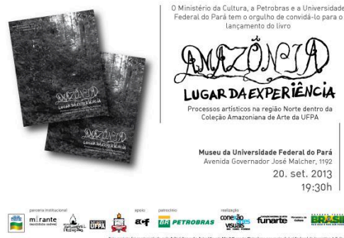
Figura 5: Convite do lançamento do livro Amazônia, Lugar da Experiência . Coleção Amazoniana de Arte da UFPA.