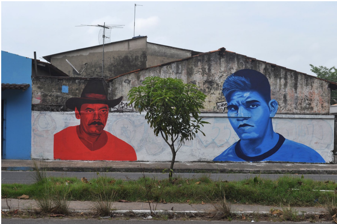
Figura 6: Éder Oliveira (1983 - ). Intervenção urbana | Pintura Mural, 2012. Coleção Amazoniana de Arte da UFPA.

de Armando Queiroz e o livro de Luciana Magno, dentre outros. Além disso, há ainda doações de obras do artista falecido Acácio Sobral.