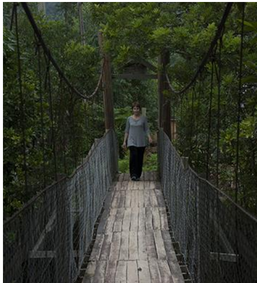
Deslocamento realizado em Aparados da Serra, março 2013.

A dimensão processual dos deslocamentos na natureza se constitui enquanto fim em si, ao mesmo tempo que engloba a produção de uma experiência que se tece na rede de relações estabelecidas a partir do lugar. Dessa forma, deslocamento é ação e conceito que orienta as operações do processo artístico. Atravessar territórios desconhecidos, atualizando as derivas situacionistas e deambulações surrealistas implica fazer do deslocamento uma experiência suscetível de destituir referências que balizam o dia a dia. Deste modo, a prática de fazer arte se estrutura a partir do ato mais primário da condição humana – o ato de caminhar, se desdobra interrogando modos de tratar as relações do sujeito com a natureza e a paisagem e coloca em prática experimentações que envolvem questões sobre o visível e o real, a aparência e a realidade, o banal e o singular.