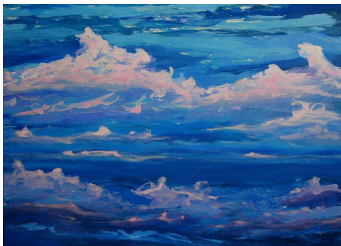
Fig. 6 – Sem título, Ariane Cole, óleo madeira, 105 x 80 cm, 2013

Onde cores solares nos remetem ao desejo de viver e as noturnas nos afetam com as sutilezas oníricas, onde as escolhas cromáticas, resultados de uma ação sempre propõem uma dimensão simbólica. Onde os elementos da natureza: o céu; o mar, as ondas movidas pelo vento; a nuvem; assim como os elementos da pintura: as linhas retas ou ondulantes; manchas, formas e cores, mais ou menos saturadas, mais ou menos contrastadas; as texturas e as luzes, tão presentes na natureza, quanto no quadro, dialogam entre si, criando camadas de significação. A paisagem assim, dança nas margens do tempo, em seus diálogos com o céu e o mar, ao sabor dos ventos, das reflexões cambiantes das águas.