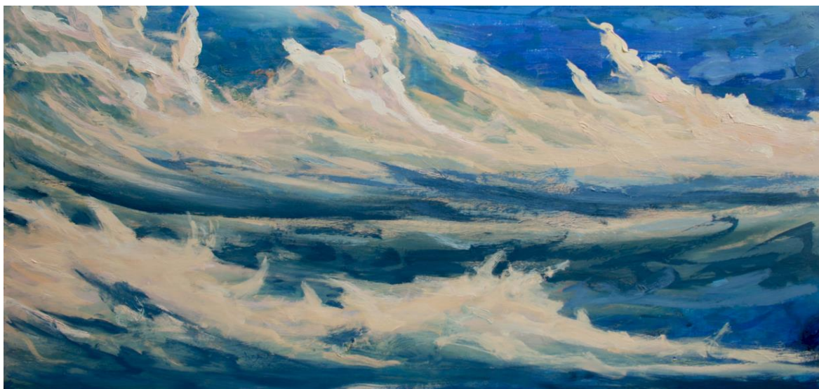
Fig. 5 – Sem título, Ariane Daniela Cole, 2013, óleo sobre madeira, 105 x 53 cm

Enquanto o fotógrafo corta, o pintor sobrepõe. Na atividade da pintura o tempo se distende, vai se revelando nas camadas da pintura, se infiltrando aos poucos no nosso espírito, por meio da experiência da visibilidade. Não há propriamente um corte, antes há um fluxo que se dá pela mobilidade do olhar, fluxo que se sobrepõe, se explicita nas camadas da pintura e se dá pelas variações cromáticas do mundo visível.