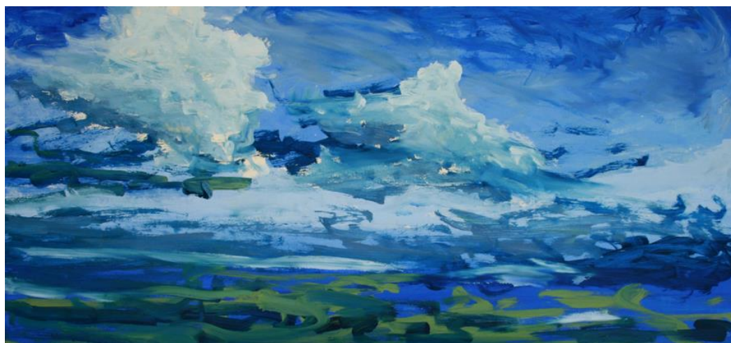
Fig. 2 –Sem título, Ariane Cole, 2012, óleo sobre madeira, 105 x 80 cm

A água agrupando as imagens, dissolvendo as substâncias, ajuda a imaginação em sua tarefa de desobjetivação, em sua tarefa de assimilação. Proporciona também um tipo de sintaxe, uma ligação contínua entre as imagens, um suave movimento das imagens que libera o devaneio preso aos objetos. (BACHELARD, 2002, P. 13)