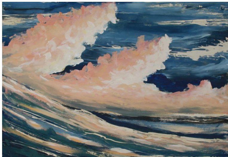
Fig. 7 - Sem título, Ariane Cole, óleo madeira, 80 x 53 cm, 2013

A aparente imobilidade, da imagem ou do artista, revela no processo de criação muitas configurações possíveis, que se multiplicam através das relações de composição, das escalas, das cores, da atmosfera, apresentando uma grande mobilidade do olhar, da percepção e da imaginação. Percepção esta que, por sua vez, pode se dar de modo direto, quando o artista está em presença do fenômeno; através do registros em desenho; de modo mediado por instrumentos técnicos, como a fotografia, ou o vídeo; por meio da memória que abre espaço para a imaginação, percepção da mente em ação, gerando uma consciência do olhar, questionando nossa intenção.