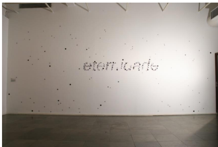
“Eternidade”. Vista da Galeria Iberê Camargo, Centro Cultural Usina do Gasômetro, Porto Alegre/RS, dez. 2008/ jan. 2009.

Chegando a mais de 5.000 imagens de cristais, ganhando o respeito da comunidade acadêmica e científica 14 .