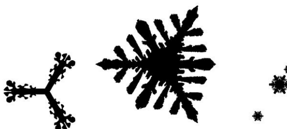
Silhuetas de flocos de neve. Imagem Digital em adesivo, tamanhos variáveis, 2008.

A “Eternidade” está incompleta para sempre, congelada como o corpo do menino Kai (na história “ A Rainha da Neve ”). O dinamismo, o movimento de uma nevasca opõe-se à maneira estática com que os flocos permanecem na parede branca. Assim como a fotografia, o trabalho desafia as leis da natureza (movimento e derretimento) e do tempo (em movimento).